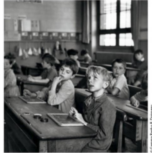
« L'Information scolaire » (1956) de R. Doisneau.